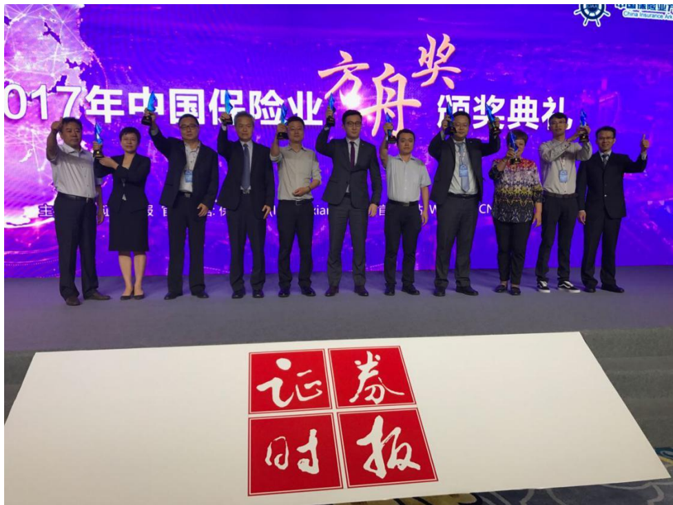
华夏保险获奖现场（左六）

“方舟”是生命财产的保障，是风险管理的工具，与保险精神高度契合。《证券时报》作为金融行业主流权威媒体，打造“方舟奖”这一行业评选品牌，有利于促进保险行业自律发展，同时提升公众对保险的认知。